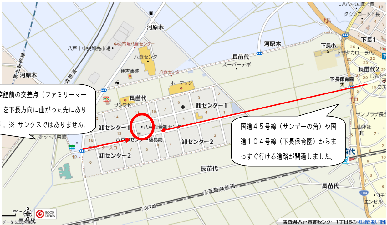
卸センター付近の地図は www.mapion.co.jp より引用させていただいています。

7:40 開会式会場が開場（八戸総合卸センター会館大展示場：八食センターの1本裏通り）